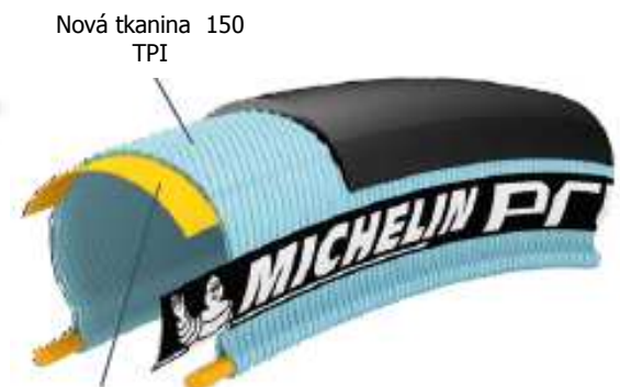
Nylonový nárazník s vysokou hustotou

Tato pneumatika je určena náročným cyklistům, kteří kladou důraz na valivou účinnost. Proto nová pneumatika MICHELIN PRO4 COMP Service Course nabízí bezkonkurenční valivou účinnost, která je v průměru o 7% lepší* než u pneumatiky MICHELIN PRO4 Service Course.